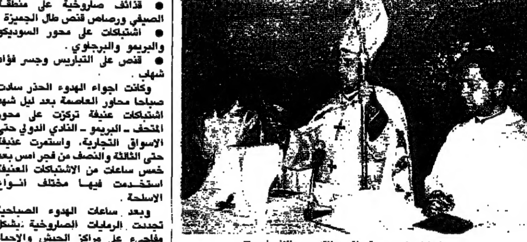
المطران ابو جودة يقف خلفه بعد الانجيل

بإشارة من مطران مار يوحنا مرقس مطران رعية مدينة جبيل، ترأس النائب المطراني العام الماروني رومان ابو جودة القداس الاحتفالي الذي اقيم في كاتدرائية المار يوحنا مرقس في جبيل والتي بناها الصليبيون في مطلع القرن الحادي عشر واستمرت فيها الرهبانية اللبنانية المارونية رعيته منذ ان تسلمتها في العام ١٧٨٦.